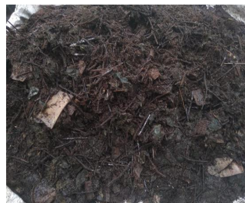
Gambar 6. Hasil Pembuatan Pupuk Organik Setelah Fermentasi

Kegiatan praktek pembuatan pupuk ini menggunakan bahan-bahan organik yang berada di sekitar Desa Padang Tumbuo yang tidak termanfaatkan terdiri dari Limbah hasil penyulingan nilam, daun gamal, batang pisang, dedak, kotoran ternak dan EM4. Pada proses pembuatan sebelumnya sudah di ajarkan dalam pelaksanaan penyuluhan dan diperkuat pada kegiatan praktek secara langsung. Berikut adalah hasil praktek pembuatan pupuk organik yang dihasilkan pada kegiatan pengabdian kepada masyarakat: