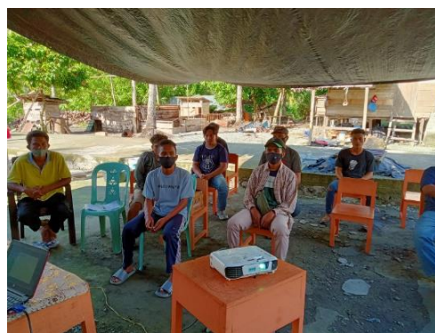
Gambar 3. Keseriusan dan Antusias Peserta Penyuluhan