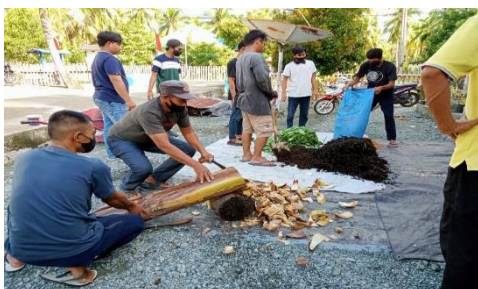
Gambar 4. Proses Pembuatan Pupuk Organik

Pada pelatihan ini tim pengabdian memberi kesempatan langsung kepada para petani dalam proses pembuatannya, tim pengabdian hanya memandu namun praktek langsung dikerjakan oleh petani sebagaimana tersaji pada gambar 4 berikut: