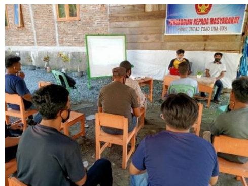
Gambar 2. Kegiatan Penyuluhan di Desa Padang Tumbuo

tersebut dengan ditunjukkan berbagai macam respon petani dalam pelaksanaan pemaparan penyuluhan, sebagaimana ditunjukkan pada gambar 2 dan 3 berikut: