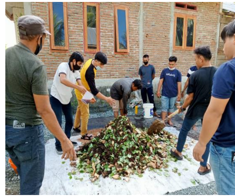
Gambar 5. Proses Pencampuran Bahan-bahan Pupuk Organik

Kegiatan praktek pembuatan pupuk ini menggunakan bahan-bahan organik yang berada di sekitar Desa Padang Tumbuo yang tidak termanfaatkan terdiri dari Limbah hasil penyulingan nilam, daun gamal, batang pisang, dedak, kotoran ternak dan EM4. Pada proses pembuatan sebelumnya sudah di ajarkan dalam pelaksanaan penyuluhan dan diperkuat pada kegiatan praktek secara langsung. Berikut adalah hasil praktek pembuatan pupuk organik yang dihasilkan pada kegiatan pengabdian kepada masyarakat: